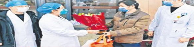
▲江西首例治愈新冠肺炎病人出院，向医护人员送花表示感谢。